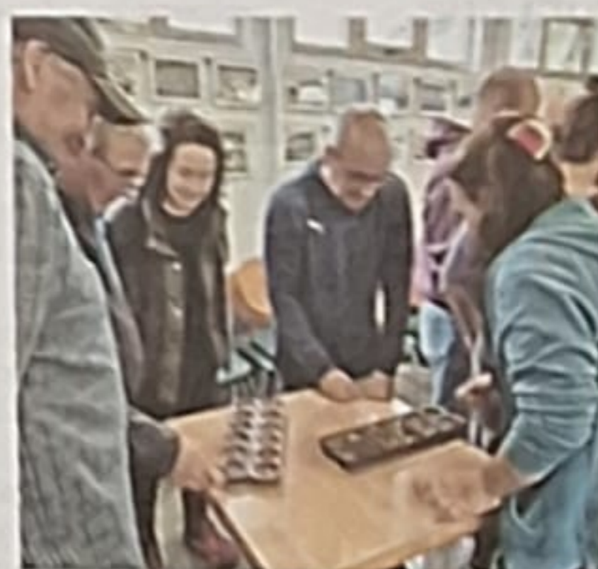
Asistentes ao curso de Muimenta, probando con varios dos xogos tradicionais presentes no encontro que se celebrou este mes.