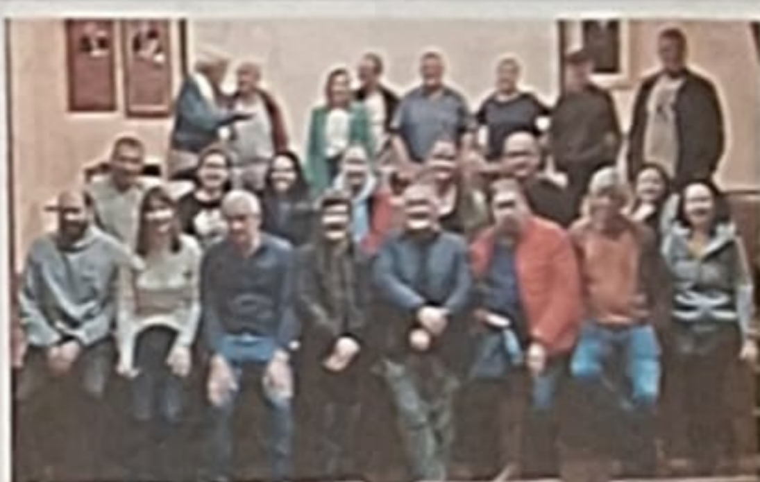
Parte dos participantes no encontro de patrimonio lúdico.

O escenario elixido para este novo encontro sobre patrimonio lúdico foi Muimenta, unha das capitais de Galicia dos xogos tradicionais, xunto a Melide, Ponteceso ou Lourenzá. Pero, que ten de particular Muimenta? «Muimenta conta cunha das entidades con máis folgos de Galicia, que é Xotramu. Pero, ademais, con todo a non ser capital de concello, ten a infraestrutura necesaria para un evento destas características: casa da cultura, recinto feiral, zona musealizada... e utilizamos todos os espazos.