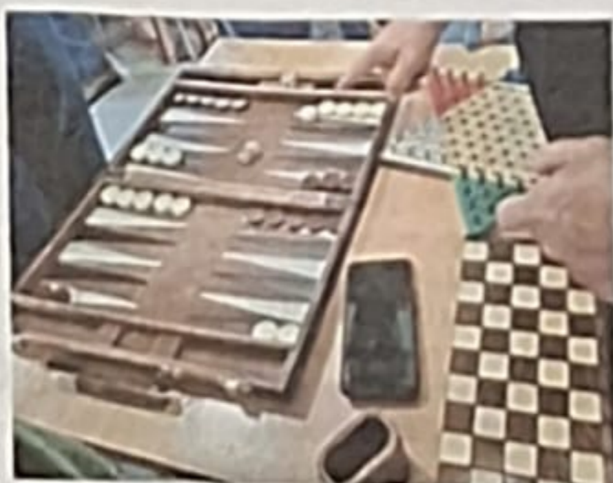
Exemplos dalgúns dos xogos tradicionais do encontro de Muimenta.

E por que motivo hai tanta riqueza lúdica en Galicia? «Aínda queda moito por investigar ao respecto», advirte Veiga. O que está claro é que todos os grupos sociais crearon xogos, «mesmo os animais que teñen garantida